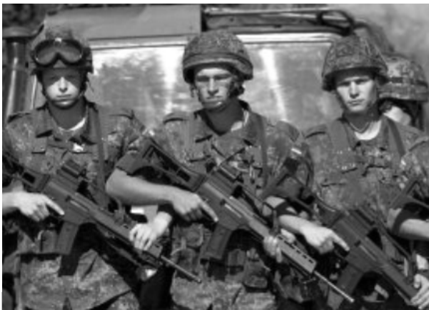
Deutsche Soldaten – weltweit im Kriegseinsatz

Ob am Horn von Afrika, in Kuwait, Afghanistan, Mazedonien, Bosnien oder im Kosovo, noch nie zuvor waren so viele Truppeneinheiten der Bundeswehr im Auslandseinsatz. Nach Ende des Kalten Krieges wandelt sich die Bundeswehr von einer Verteidigungs- hin zu einer Interventionsarmee.