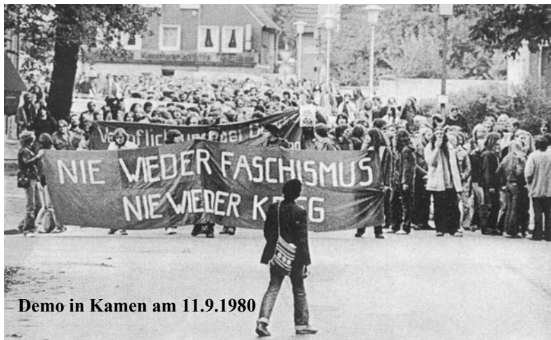
Demo in Kamen am 11.9.1980

Dennoch versammeln sich um 17.45 Uhr über 500 AntimilitaristInnen in der Fußgänger und halten trotz Verbotes ihre Kundgebung ab. Die Kundgebung kann von der Polizei ungestört abgehalten