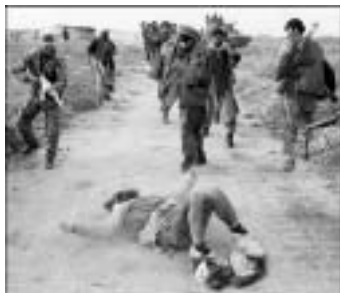
Aufnahme aus unter Kontrolle von NATO(D) und Nord-Allianz befindlicher Gebiete

Mit der Nord-Allianz stehen uns treue Verbündete beim Aufbau der ZIVILISATION bei. Meldungen über von ihr begangene „Massaker“ sind von radikalen Pazifisten gezielt verbreitete Lügen, um unsere Arbeit zu diskreditieren – überzeugen sie sich selbst vom Gegenteil: