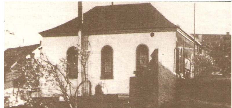
Iserlohner Synagoge vor der Zerstörung am 09. November 1938

Schwarze Katze, Postfach 41 20, 58664 Hemer http://schwarze.katze.dk